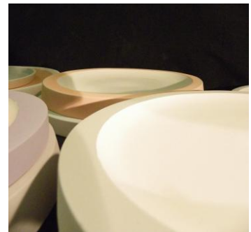
Assiettes tournées. Diamètre 18 à 27 cm. Grès engobé.

Je tourne ces volumes, puis dans un jeu coloré je reforme un utilitaire.