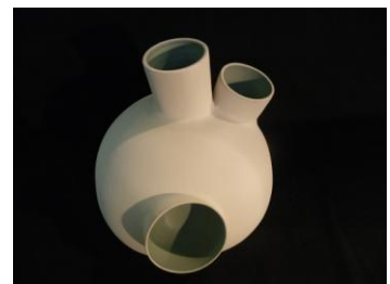
Architecture tournée, assemblée. Diamètre 33 cm, H 31 cm. Grès chamotté, engobé.

A travers l'agencement des différents éléments je donne l'idée d'un ordre, d'un équilibre général où chaque chose est bien... à sa place !