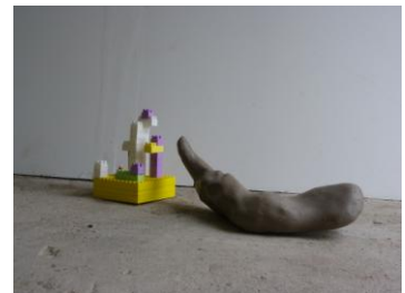
Tirage numérique couleur, L50*H75 cm

Cette série de quatre photos présente une forme primitive archaïque de l'humain, confronté à la réalité du monde à travers quatre face-à-face.