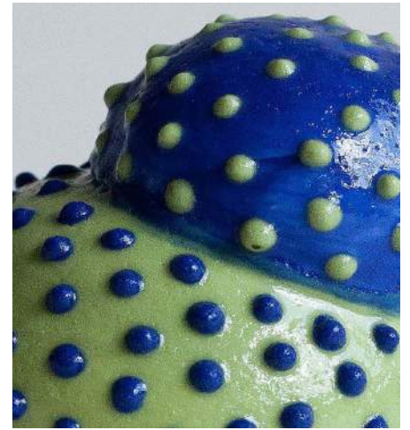
Ensemble de contenants, porcelaine de Limoges tournée, engobes pigmentaires, coulage coloré dans la masse, cuisson oxydante 1280°